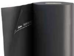
TRASPIR EVO UV 115 page 254