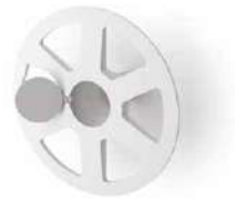
THERMOWASHER page 145