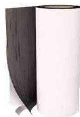
GROUND BAND page 34