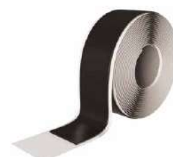
BLACK BAND page 136