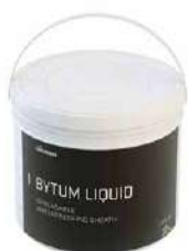
BYTUM LIQUID page 42