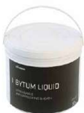
BYTUM LIQUID стр. 48